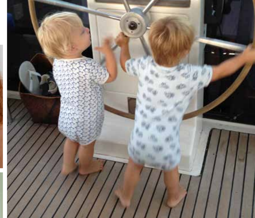
Tvillingerne var med over Atlanten, da de var 1½ år gamle og over Stillehavet da de var 2.